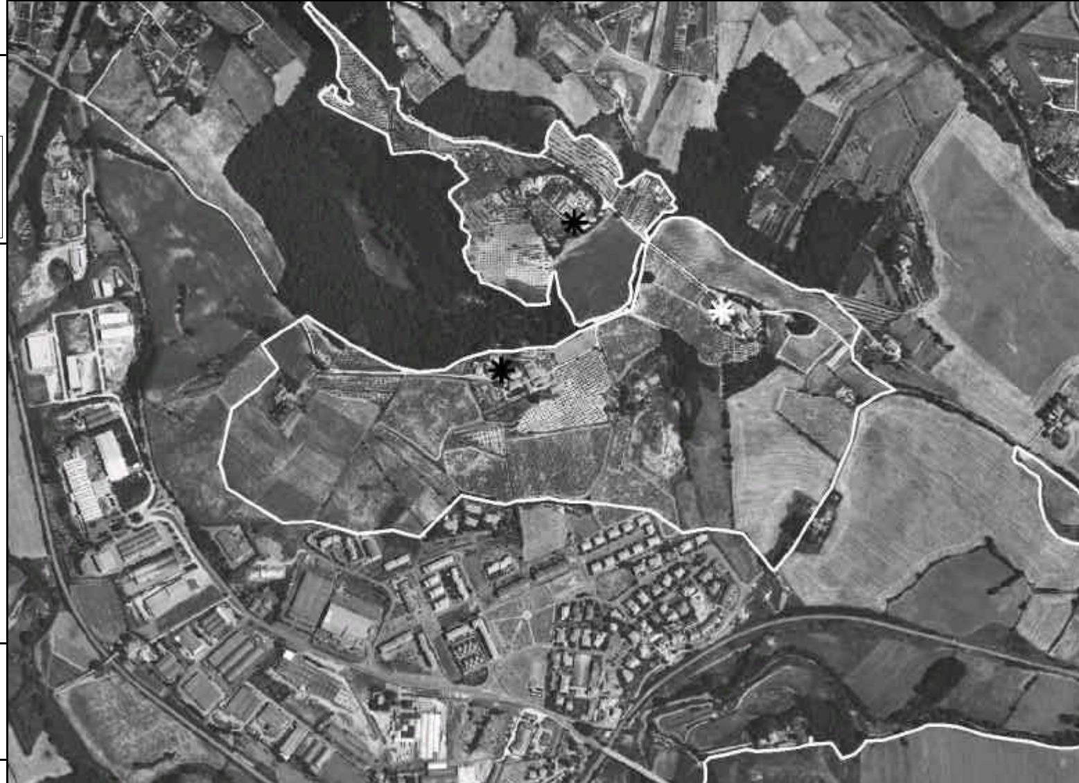
COD_BSA 9052022048 VOLO 1977-78 scala: 1/ 10000 TRATTO CONTINUO: PERIMETRO AREA DI PERTINENZA RILEVAMENTO ANNI 1997/98