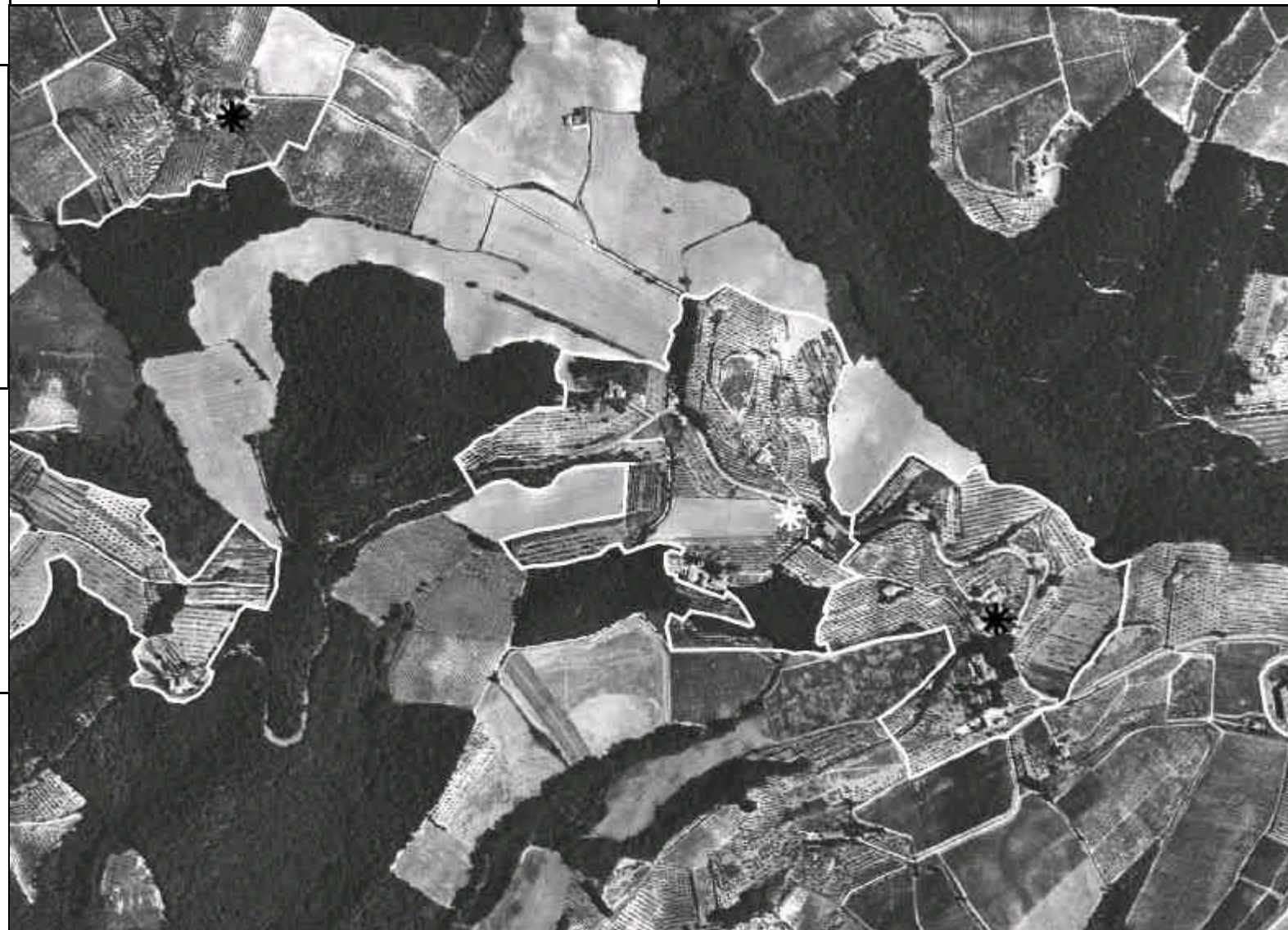
COD_BSA 9052022017 VOLO 1996 scala: 1/ 10000 TRATTO CONTINUO: PERIMETRO AREA DI PERTINENZA