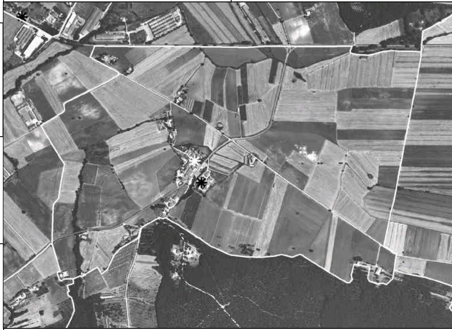
COD_BSA 9052016017 VOLO 1996 scala: 1/ 10000 TRATTO CONTINUO: PERIMETRO AREA DI PERTINENZA

5 - CONDIZIONI SOCIO - ECONOMICHE Popolazione 1833 314 1951 166 1991 91 Censimento 1991 n. famiglie 24 n. abitazioni 25 n. abitazioni non occupate 1 % abitazioni non occupate 4 Altro tabaccaio distributore autofaccina Servizi ed impianti produttivi esistenti Chiesa Bar Alimentari Ritrovo/Casa del popolo Scuola elementare Impianti produttivi