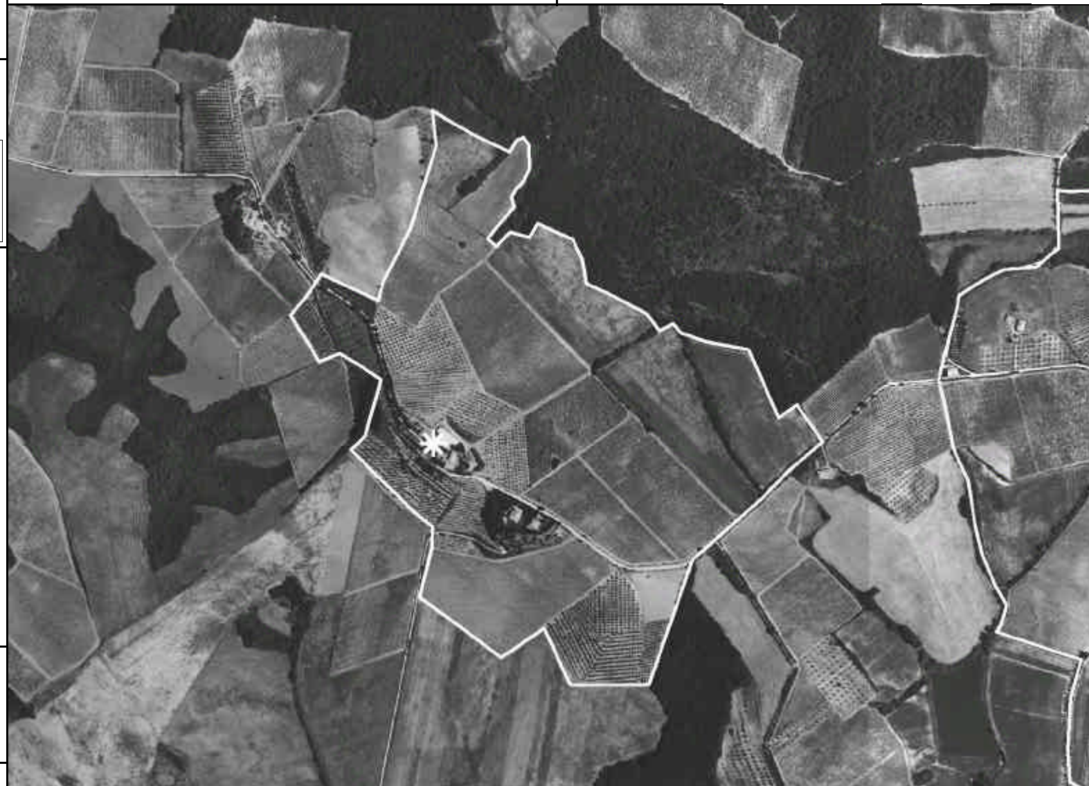
COD_BSA 9052005051 VOLO 1977-78 scala: 1/ 10000 TRATTO CONTINUO: PERIMETRO AREA DI PERTINENZA